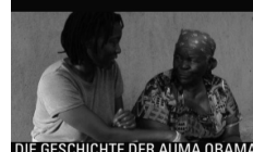
DIE GESCHICHTE DER AUMA OBAMA