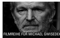
FILMREIHE FÜR MICHAEL GWISDEK