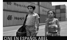
CINE EN ESPAÑOL ABEL