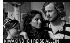
KIWAKINO ICH REISE ALLEIN