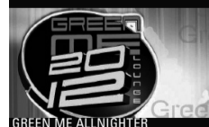
GREEN ME ALLNIGHTER