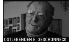
OSTLEGENDEN E. GESCHONNECK