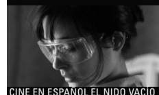
CINE EN ESPAÑOL EL NIDO VACÍO