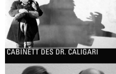
CABINETT DES DR. CALIGARI