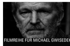
FILMREIHE FÜR MICHAEL GWISDEK

VATERLANDSVERRÄTER Der größte Feind im ganzen Land, das ist und bleibt der Denunziant. Diesen Spruch seiner Mutter hatte der Schriftsteller Paul Gratzik, aus einfachen Verhältnissen in den 1970ern zu einem gefeierten Vertreter der DDR-Literaturszene emporgestiegen, immer im Ohr. Trotzdem war er 20 Jahre lang Inoffizieller Mitarbeiter des DDR-Staatssicherheitsdienstes, schrieb Berichte über Freunde und Förderer wie Heiner Müller, Steffie Spira und Ernstgeorg Hering. Anfang der 1980er stieg Gratzik aus, enttarnte sich selbst und wurde seinerseits zum Objekt der Stasi-Beobachtung. SO 14:00