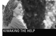
KIWAKINO THE HELP