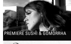
PREMIERE SUSHI & GOMORRHA