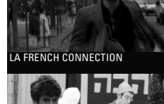
LA FRENCH CONNECTION