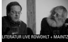
LITERATUR LIVE ROWOHLT + MAINTZ