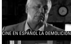
CINE EN ESPAÑOL LA DEMOLICIÓN