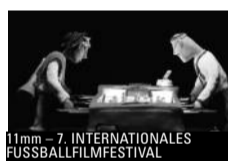
11mm – 7. INTERNATIONALES FUSSBALLFILMFESTIVAL

SOLINO Mit etlichen Referenzen an italienische Kinotraditionen erzählt Fatih Akins Einwandererchronik vom Schicksal der Amatos. Durch drei Jahrzehnte begleitet der Film die sizilianische Familie, vor allem Sohn Gigi. DO 20:30 FATIH AKIN WERKSCHAU