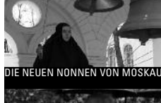
DIE NEUEN NONNEN VON MOSKAU