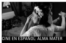
CINE EN ESPAÑOL: ALMA MATER

DIE NEUEN NONNEN VON MOSKAU Das orthodoxe Iwanow-Kloster liegt mitten in Moskau, keine 500 m vom Kreml entfernt. Siebzig Jahre war es Gefängnis und Archiv des KGB. Die neuen Nonnen von Moskau bauen nun das Kloster wieder auf. Eine Architektin, eine Archäologin, Ingenieurin, Juristin und Philosophin - russische Frauen aus zwei Generationen. Die älteren von ihnen haben Kinder und Enkelkinder. Dennoch haben sie sich für ein Leben im Kloster entschieden. Mit der Weihe zur Nonne wird der Schritt ins Kloster endgültig. Die Zeremonie findet unter strengem Ausschluss der Öffentlichkeit statt.