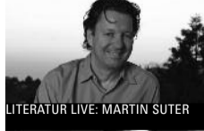
LITERATUR LIVE: MARTIN SUTER