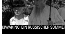
KIWAKINO: EIN RUSSISCHER SOMMER