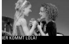
HIER KOMMT LOLA!