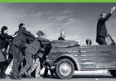
DIE PARTEI – DER FILM